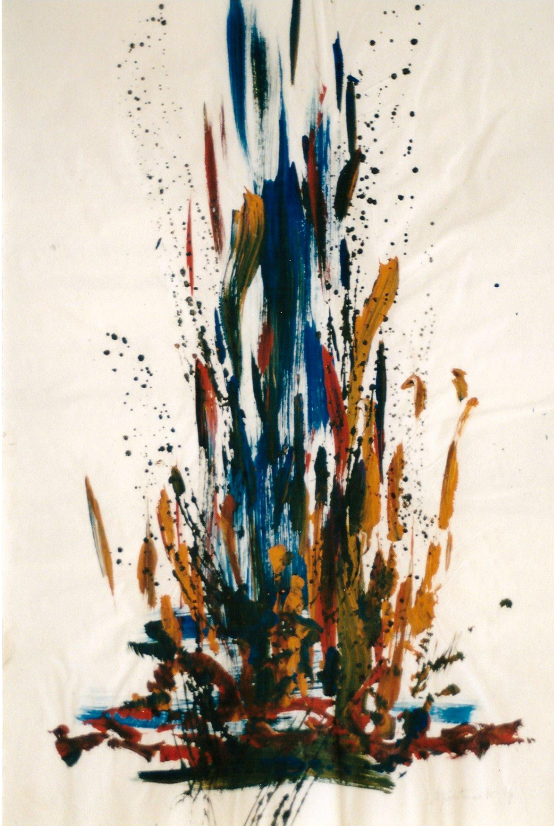
'Rush' sous emprise rythmique - Feu