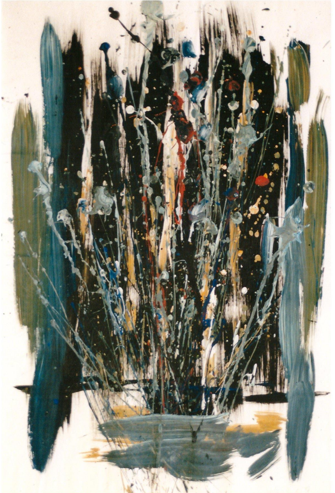
'Rush' sous emprise rythmique - Feu